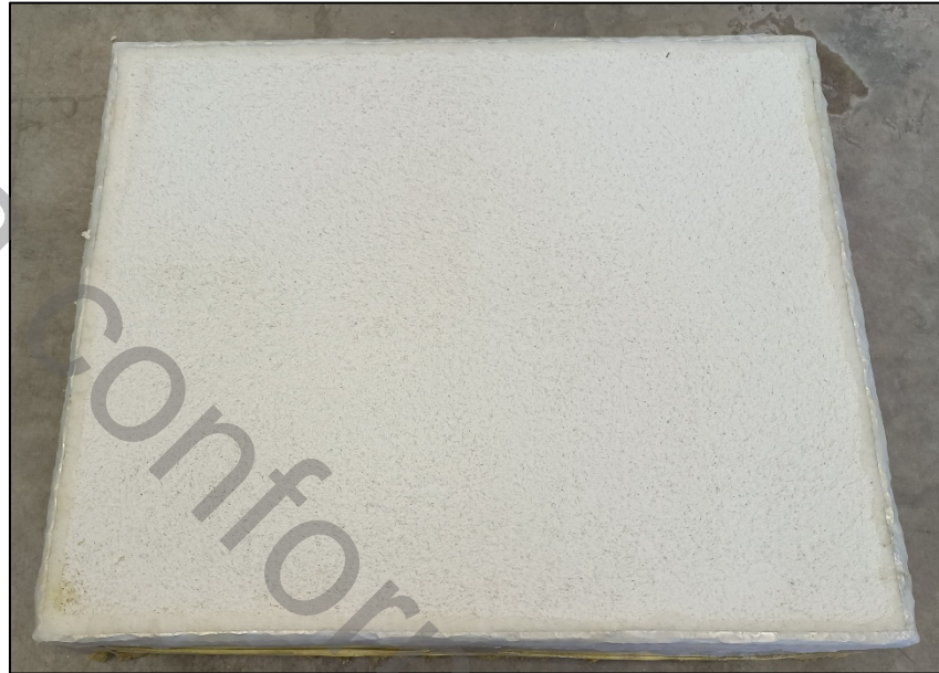
Fotografia di una provetta