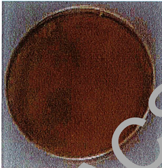
Sviluppo algale su substrato senza provino

La prova è superata in quanto non si riscontra sviluppo algale sulla superficie del provino.