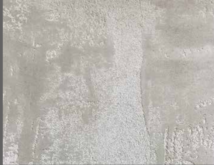
CONCRETO - CO 01 (OT 31) Effetto Materico - Materic Effect