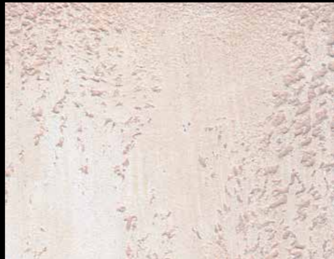
MATERIA ROMANA + MATERIA ROMANA FINITURA - MA 03

Tinte per / Colours for MATERIA ROMANA FINITURA