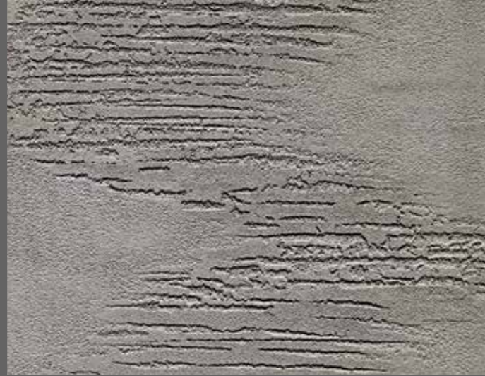
CONCRETO - CO 04 (OT 34) Effetto Striato - Streaked Effect