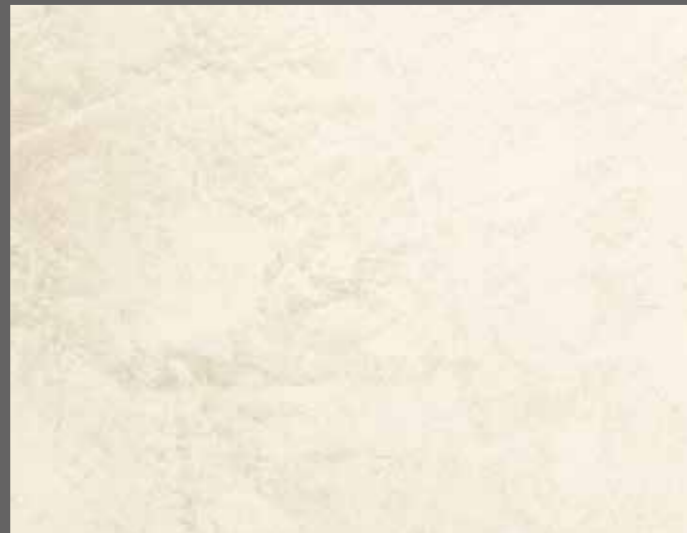
OLD TIME MAX + OLD TIME FINISH - OT 62 (CO 62) Effetto Marmorino - Marmorino Effect

Tinte per i prodotti / Colours for the products CONCRETO, OLD TIME, OLD TIME MAX (SP), OLD TIME FINISH