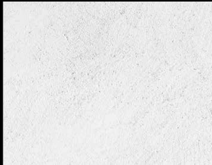
MATERIA ROMANA+ MATERIA ROMANA FINITURA - MA 00