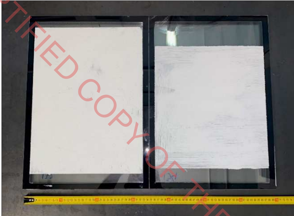
Fotografia dell'oggetto Photograph of the item

The item under examination consists of decorative based on slaked lime, natural pigments, fine mineral fillers.