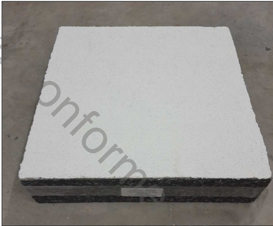
Fotografia di una provetta