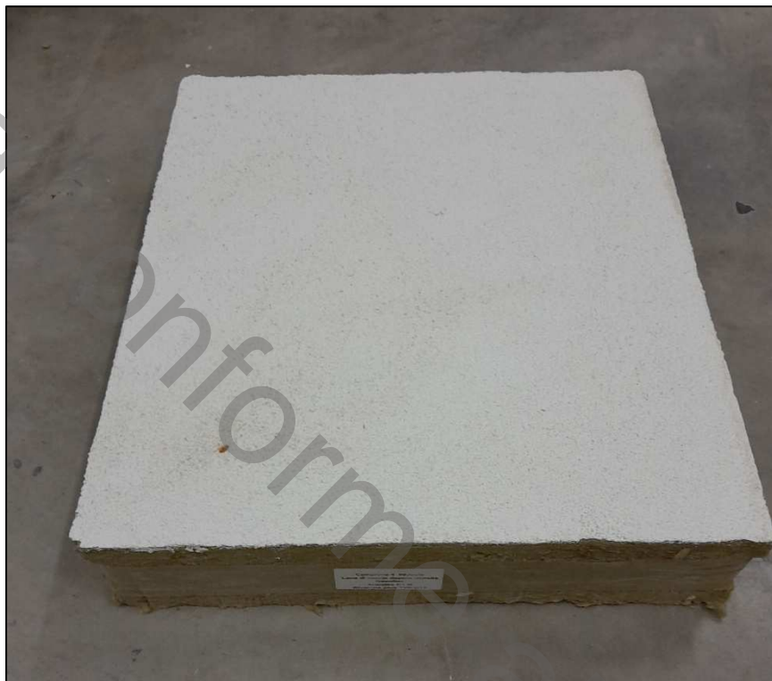
Fotografia di una provetta